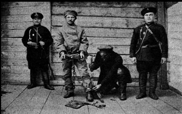
Początki XX w. Strażnicy więzienni zakuwają osadzonego