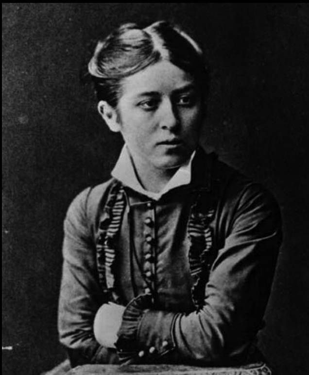
Wiera Figner, jedna z najświetniejszych nihilistek rosyjskich (1880)