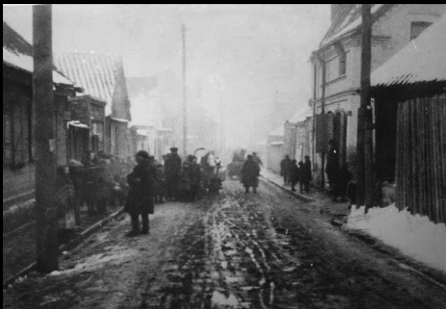
Dzielnica robotnicza w Białymstoku