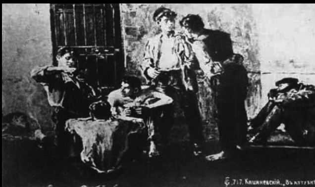
Obraz Salomona Kiszyniewskiego W lochu (1906)