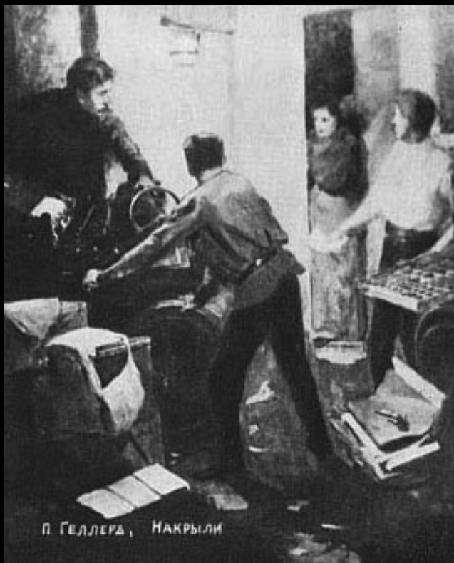
Obraz Piotra Gellera Nakryli nas (1906)