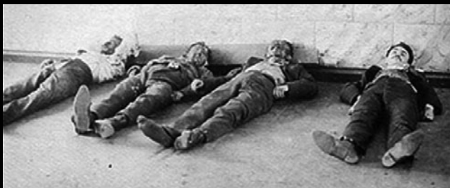
Zamordowani podczas antysemickiego pogromu w Białymstoku w 1906 r.