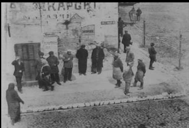
Róg jednej z białostockich ulic