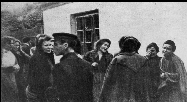
Bliscy tych, którzy zginęli w pogromie, pod murami szpitala żydowskiego, gdzie złożono zwłoki pomordowanych