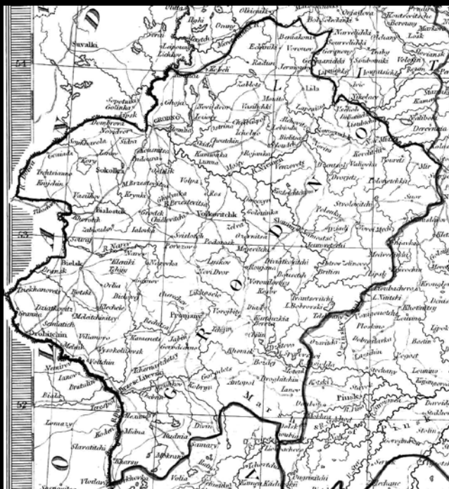
Archiwalna anglojęzyczna mapa gubernii grodzieńskiej Imperium Rosyjskiego, do której przyłączono Białystok w 1843 roku (przedruk z wydania oryginalnego)