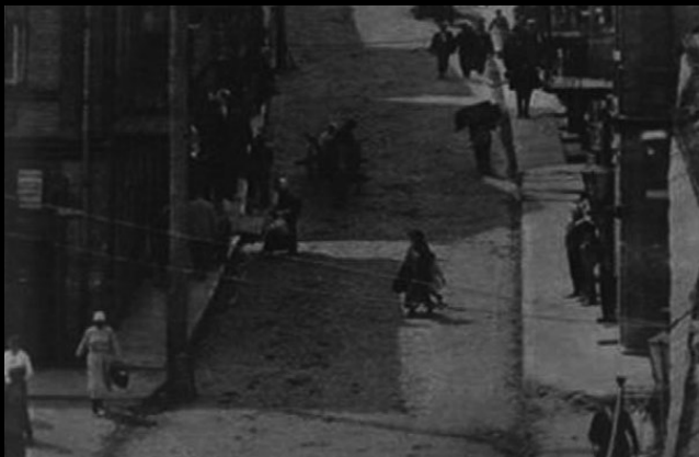
Ulica Suraska, „twierdza” anarchistów