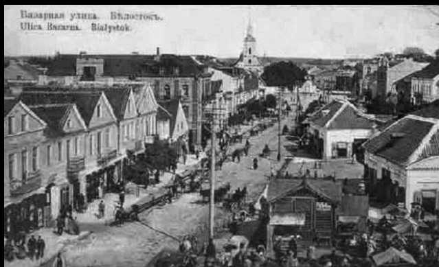
Życie na białostockiej ulicy na początku XX wieku