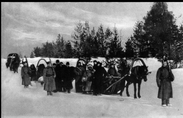
„Konwój więźniów na Sybir”, pocztówka solidarnościowa przygotowana przez Anarchistyczny Czarny Krzyż w USA, początki XX w.