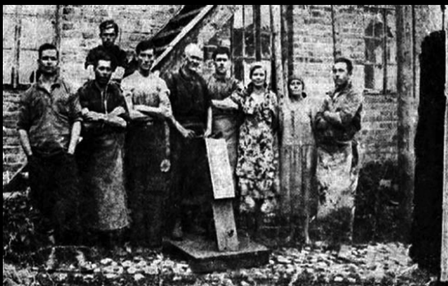
Kryneccy garbarze i garbarki