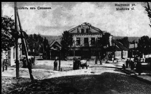
Słonim w początkach XX w.