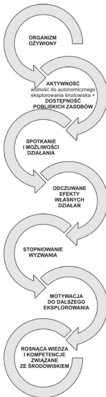
Rycina 3. Cykl interakcji między dostępnością, mobilnością i zaangażowaniem w środowisko